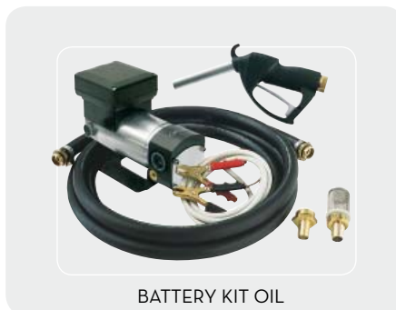
BATTERY KIT OIL