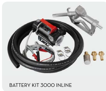
BATTERY KIT 3000 INLINE