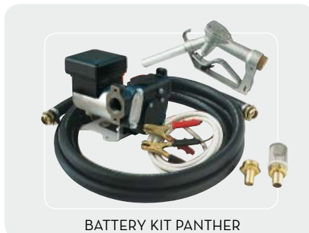
BATTERY KIT PANTHER