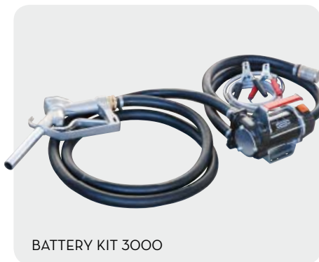
BATTERY KIT 3000