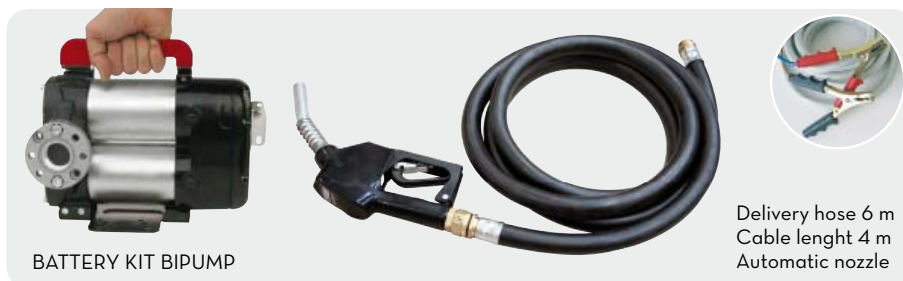
BATTERY KIT BIPUMP

Delivery hose 6 m Cable lenght 4 m Automatic nozzle