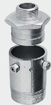
2" QUICK COUPLING