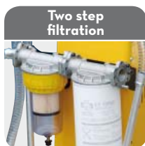
Two step filtration