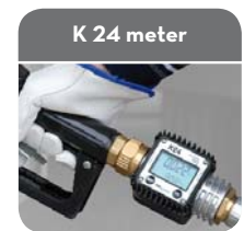
K 24 meter