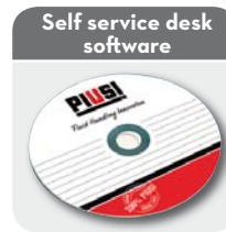
Self service desk software