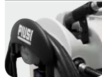
Large & Robust Hose Holder