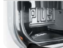
Sturdy Stainless Steel Plate