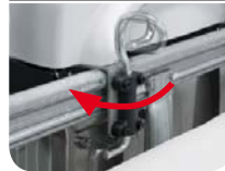
New Safety lock bracket system