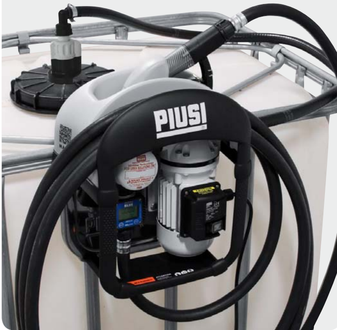
PIUSI THREE25 with SEC, K24 and SB325