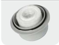
AdBlue® long life 3D Filter