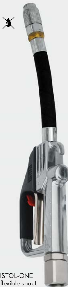
PISTOL-ONE + flexible spout