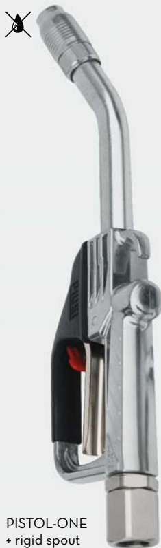
PISTOL-ONE + rigid spout